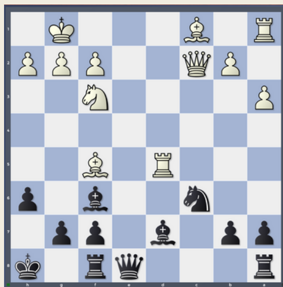
Diagram 2: Črni na potezi zmagata!