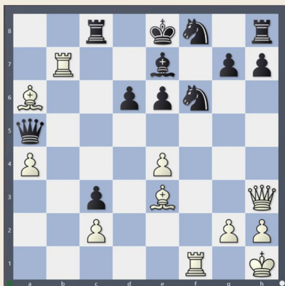
Diagram 1: Beli na potezi zmagata!

Diagram 2: 1.Lxa4 Dxa4 2.Txc8 Txc8 3.Sh6+ gxh6 4.Dg4+ Kh8 5.Dx c8 +-